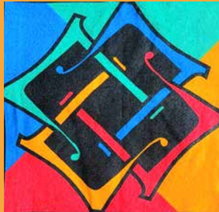
Livraria Lello in Porto